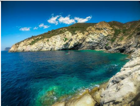
Cala del Fico