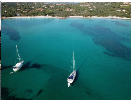
Sizilien - Porto Istana