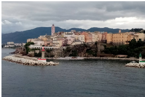
Corsica - Bastia